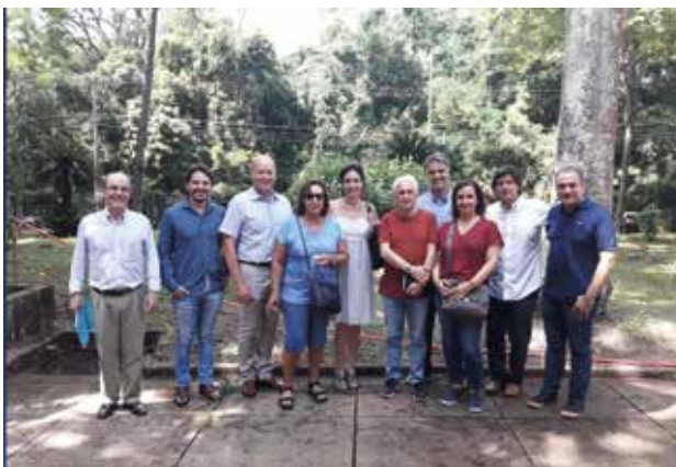
Visita ao Museu do Café.

Estamos agindo para viabilizar a reforma e revitalização dos museus. Acompanhamos a finalização de um estudo realizado pela faculdade Moura Lacerda, conveniado com a prefeitura, para apresentarmos sugestões de projeto arquitetônico e de financiamento.